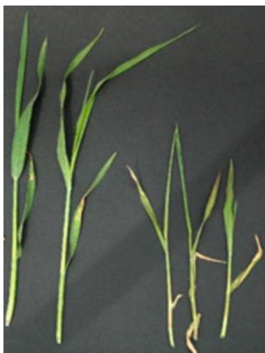
Калий етарли бўлганда