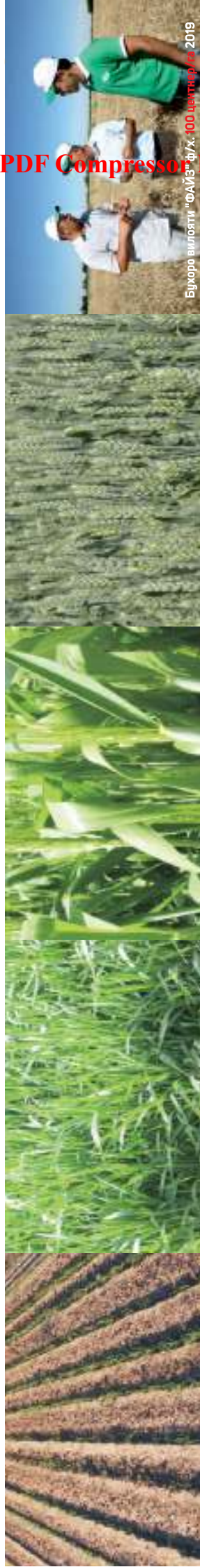
Бўжоро вилости "ФАЙЗ" ш/х. 100 центнер / г. 2019